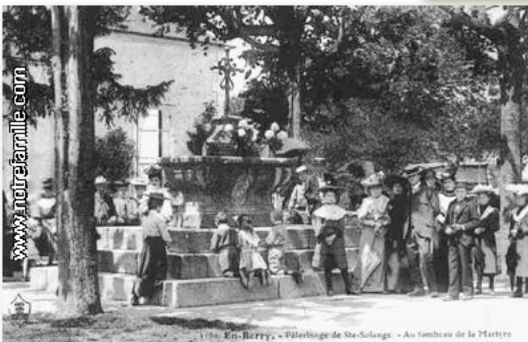
1170. En-Berry, - Pèlerinage de Ste-Solange. - Au tombeau de la Martyre