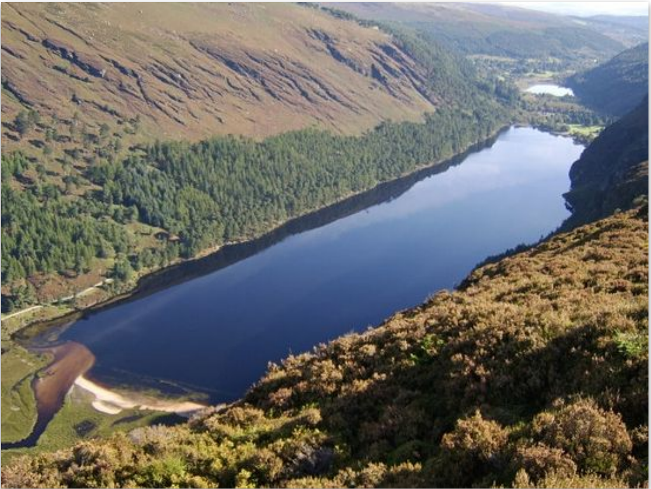
lac de Glendalough

Comme d'autres saints irlandais, Kevin vivait en harmonie avec la nature, en particulier avec les animaux sauvages qui le servaient. On disait même que parfois les branches et les feuilles des arbres chantaient de douces chansons à Kevin ! Nous mentionnerons quelques-unes des histoires les plus connues. Le plus célèbre est qu'une fois, alors que Kevin se tenait concentré dans une prière silencieuse, les bras tendus, un merle se posa sur ses paumes, y construisit un nid, fit éclore des œufs, s'occupa de ses oisillons puis s'envola (pendant toute cette période, le saint ne bougeait pas et ne faisait que prier, tandis que le merle lui donnait des baies comme nourriture). Les artistes ont longtemps aimé représenter cette scène de la vie du saint. Selon une autre histoire, dans l'un des deux lacs vivait une loutre qui a aidé l'ermite pendant de nombreuses années. Quand il vivait seul, il lui apportait parfois du poisson, et quand Kevin était abbé, il livrait du saumon aux frères, surtout en période de famine. Une fois, alors que l'homme de Dieu priait dans l'eau froide du lac, il a accidentellement laissé tomber son livre de prières dans l'eau. La loutre à cette minute même sortit tenant le livre de prières dans sa bouche – le livre était absolument intact. Une fois, un moine fut pris de cupidité : il décida de tuer la loutre et d'utiliser sa peau pour se faire des gants. Mais le mammifère intelligent a senti sa mauvaise intention et a tranquillement quitté ce site pour toujours.