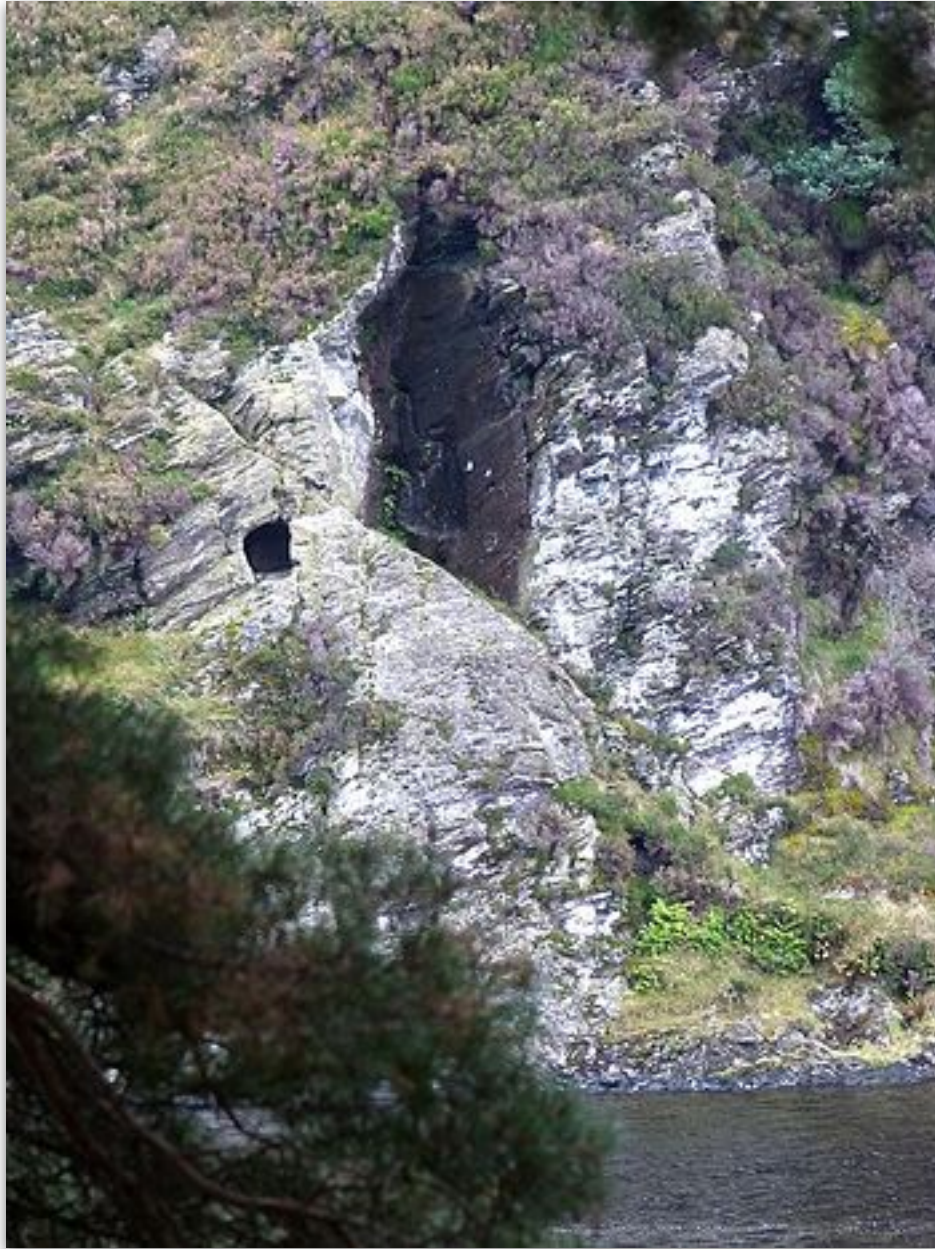
cave du saint

Il marchait pieds nus, portait des vêtements très grossiers et ne mangeait que diverses sortes d'herbes et de racines, ne s'autorisant que parfois des fruits et du poisson. L'activité principale dans sa solitude était la prière à Dieu qui a accordé à son disciple le don de faire des miracles. Les disciples se rassemblèrent progressivement autour de lui et ainsi le saint fonda le monastère de Glendalough, qui était destiné à devenir l'un des centres monastiques les plus importants et les plus influents de l'île d'Émeraude. Kevin est devenu son premier abbé. Peu de temps après, selon une source tardive, Kevin se rendit à Rome en pèlerinage et rapporta de là des reliques sacrées qui furent placées à l'intérieur de son monastère.