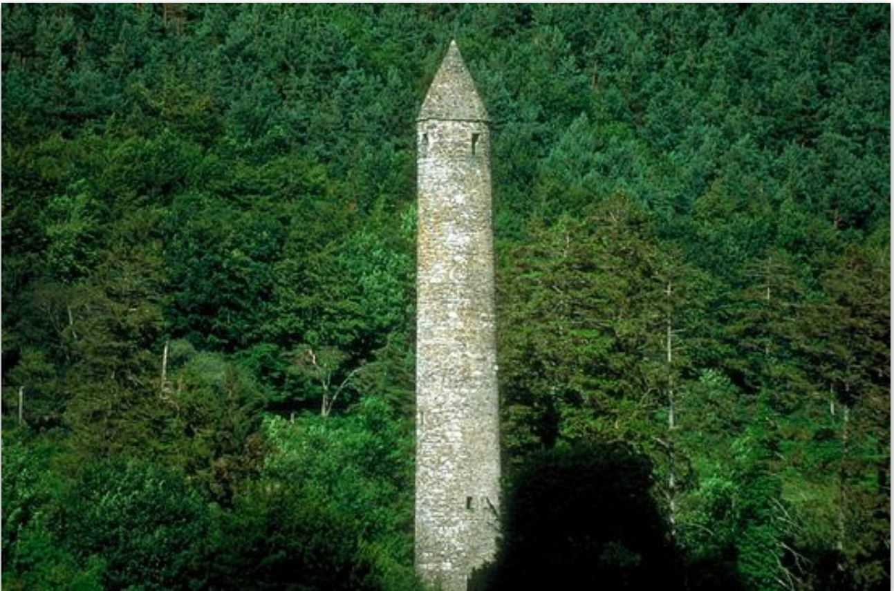
tour ronde de Glendalough

Voici quelques exemples supplémentaires des miracles de St. Kevin. Une fois, un jeune homme qui souffrait beaucoup de crises eut une vision dans laquelle on lui dit de venir voir Kevin et de manger une pomme dans sa communauté. Mais il n'y avait pas de pommiers au monastère. Ensuite, Kevin a commandé une rangée de saules. Saint Kevin aimait la vie recluse et, après quelques années en tant qu'abbé, il s'est de nouveau retiré dans sa solitude bien-aimée. Mais quatre ans plus tard, les moines le persuadèrent de retourner au monastère et de reprendre ses activités d'abbé, d'enseignant et de maître. Le saint y vit la volonté de Dieu et retourna avec joie au monastère, restant à sa tête jusqu'à la fin de sa vie, présidant les frères pendant plus de 60 ans. La colonie monastique a été considérablement agrandie, des églises supplémentaires ont été construites (sept en tout) et la fameuse «tour ronde» a été ajoutée. De plus en plus de moines rejoignent la communauté et de nombreux hommes, humbles et riches, jeunes et vieux, affluent au séminaire du monastère pour recevoir une formation et une instruction à la vie chrétienne et monastique. De nombreuses personnes de diverses régions d'Irlande ont afflué vers le saint abbé Kevin pour des conseils, une consolation et une guérison – et à chaque fois ont reçu de lui de l'aide.