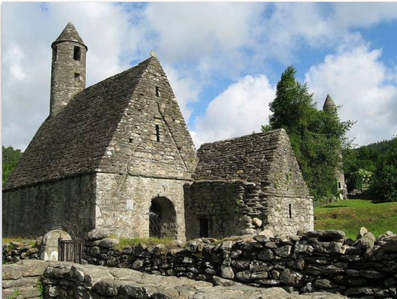
l'église du saint à Glendalough, Wicklow

Kenneth (Canice) et Kieran de Clonmacnoise. La vieille tradition raconte que Kevin, inspiré d'en haut, a visité St. Kieran juste avant son repos (de Kieran) et lui a donné la communion. En guise d'adieu, Kieran lui a donné sa cloche personnelle. Parmi les disciples de Kevin, on peut citer le saint hiérarque Moling, évêque de Fougères. Après la mort de ce saint, son monastère de Glendalough a continué de croître et de se développer, produisant de nombreux saints. Avec le temps, il a été transféré plus près du lac inférieur à Glendalough.