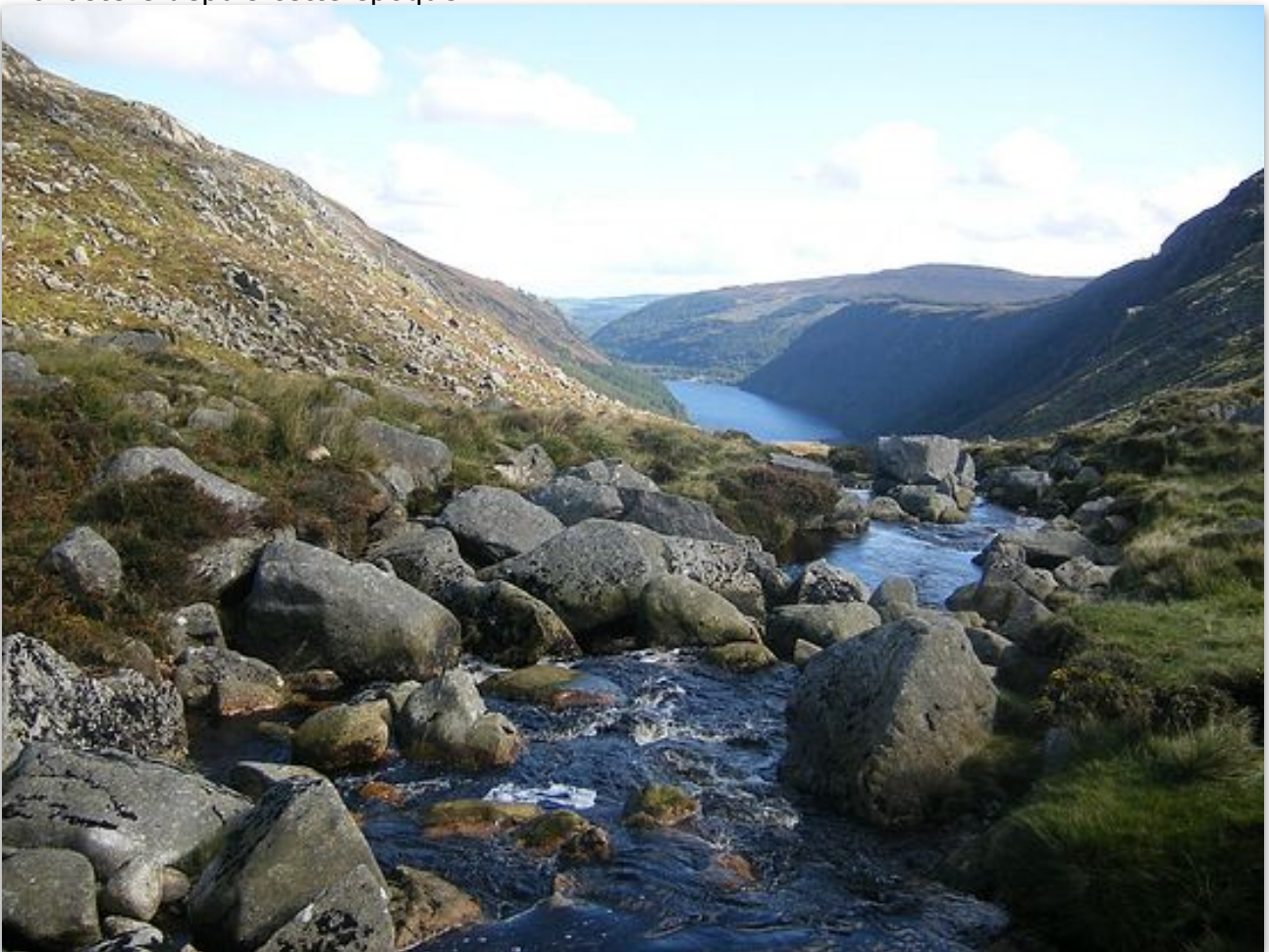
vallée de Glendalough