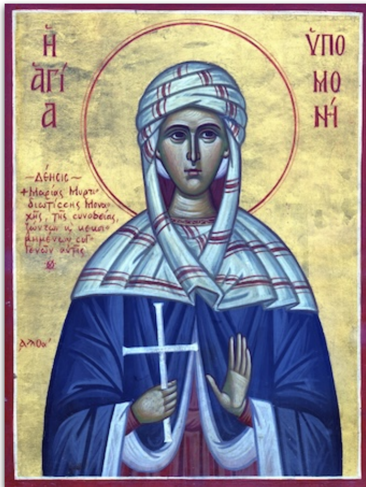
ICÔNE DE LA SAINTE QUI SE TROUVE AU FOYER

La seule chose qui nous vient peut-être spontanément à l'esprit devant la vénérable Hypomoni est de la magnifier comme le fait aussi notre Église : «Réjouis-toi, Hypomoni, toi qui as été un modèle de patience, pilier de chasteté, rempart inébranlable des vertus et trésor d'amour, toi qui es le glorieux sommet des reines inspirées de Dieu.»